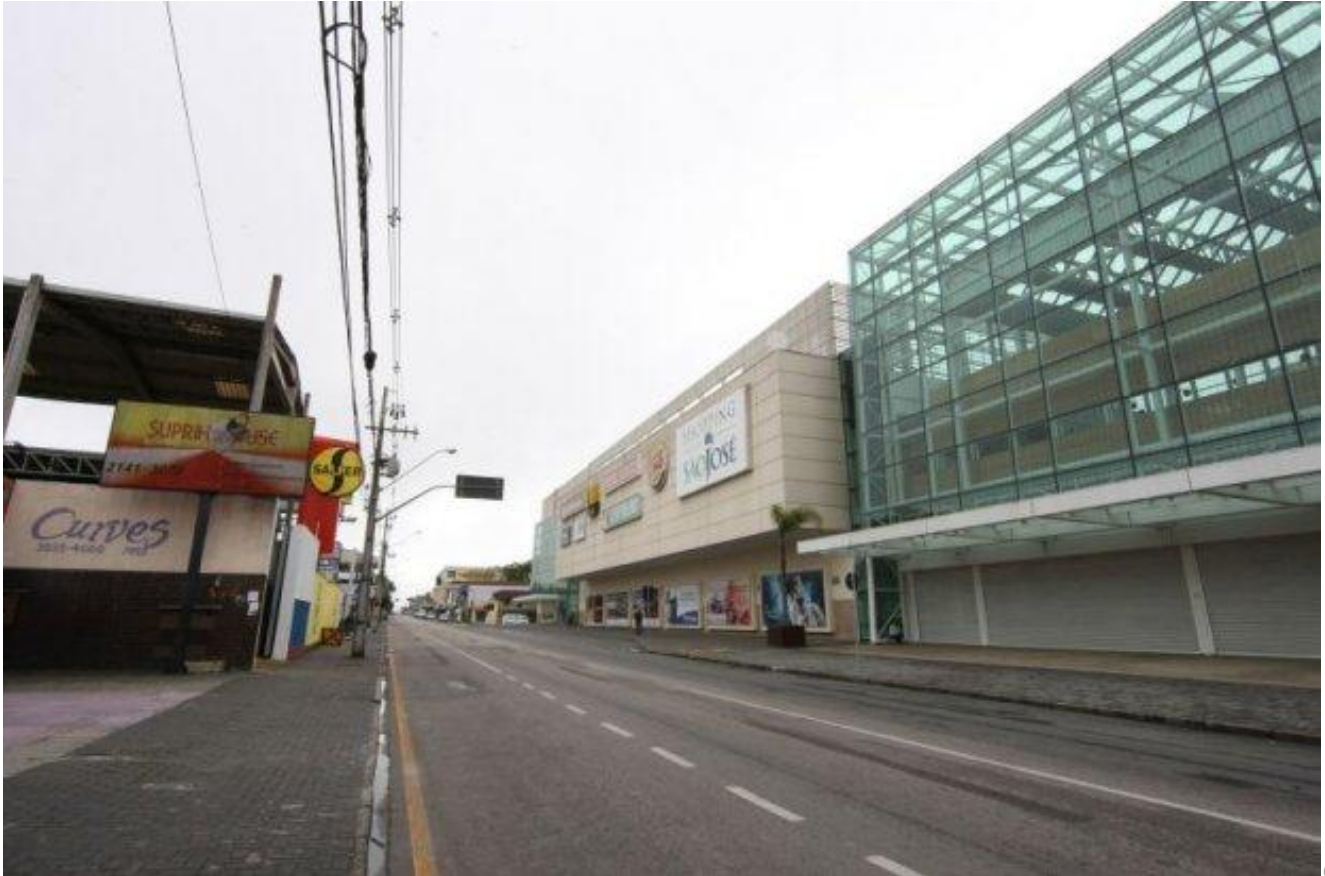
Shopping São José e sua vizinhança: influência sobre os imóveis da região